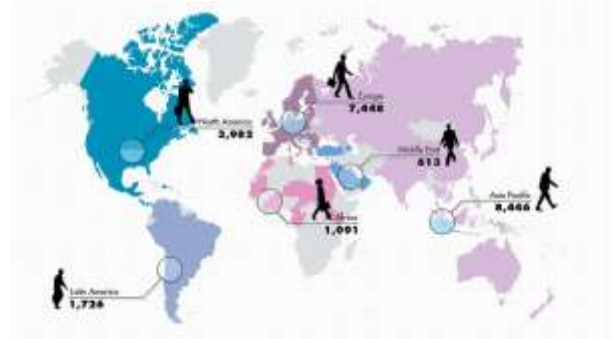
Nº 12 a nivel mundial

Los miembros de Kreston ofrecemos uno de los mejores asesoramientos financieros que existe, tanto a nivel nacional como internacional. Y a través de nuestra profunda comprensión tanto de nuestros clientes como de los retos y oportunidades profesionales a los que actualmente se enfrentan, les orientamos hacia la consecución de sus objetivos allí donde lo necesiten.